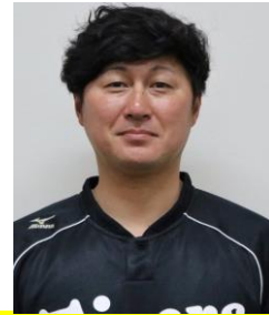
元阪神タイガース 藤川俊介氏