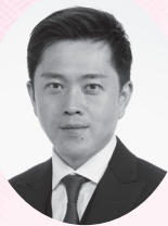
大阪府知事 吉村 洋文