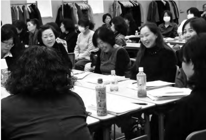
なごやかに話し合う全国の母子部長

3月13日(日)東京で開催された、「平成27年度全国母子部長研修会」に参加して来ました。全国6ブロックの代表者から、それぞれのブロックでの取り組みや、問題点などの活動報告の発表があり、とても参考になりました。その後、各ブロックに分かれて平成「28年度の活動目標」について話し合いました。大阪府のみならず、全国共通している大きな課題は会員の減少です。どうすれば食い止められるのか、また会員を増やす事が出来るのか？それは「魅力ある会」