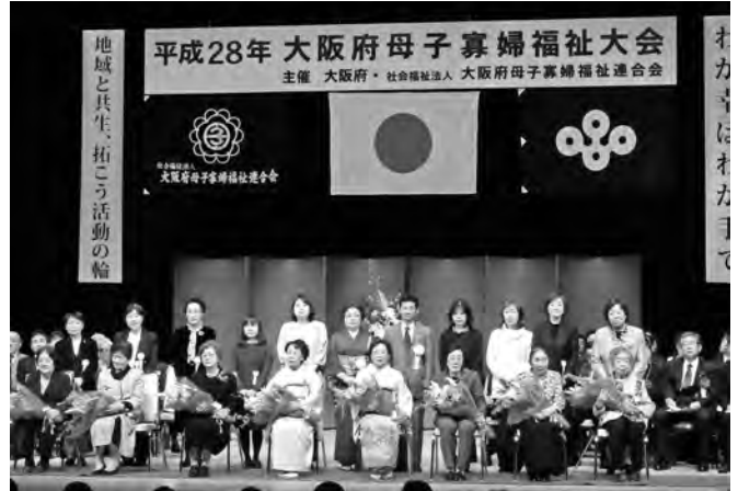
大阪府知事表彰を受賞された方々

平成28年2月13日(土)クレオ大阪中央に於いて、約千名が参加し、平成28年大阪府母子寡婦福祉大会を開催しました。国会議員、府議会議員他、多数の来賓の方々にご臨席いただき、高齢寡婦8名、母子家庭の母8名、母子福祉功労者3名が大阪府知事表彰を受賞しました。また、昨年、全国母子寡婦福祉研修大会を開催し、大阪府母子家庭母の集いが開催されなかったため、例年母の集いで表彰される理事長表彰を、各市町村から推薦された母子家庭の母29名と永年