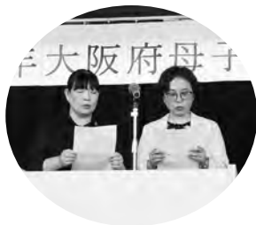
決議を提案する石田・山口 母子部代表(左から)

第1部では、開会后、各市町村から推薦された母子家庭の母24名と永年勤続職員3名が理事長表彰を受賞しました。子どもの発表では中学1年生、高校2年生の2名の子どもが将来の夢や母への思い、周りの人への感謝の気持ちを作文にして発表し、その姿に胸が熱くなりました。その後、母子部代表者が今後のひとり親や寡婦の生活向上のための「決議案」を提案し、参加者一