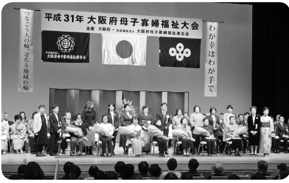
大阪府知事表彰を受賞された方々

平成31年2月11日（祝）クレオ大阪中央に於いて約1000名が参加し、また国會議員、府會議議員他、多数の来賓の方々にご臨席いただき大阪府母子寡婦福祉大会を開催しました。大阪府知事表彰では、高齢寡婦8名、母子家庭の母8名、母子寡婦福祉功労者4名が受賞しました。式典後、母子家庭の母と寡婦による体験発表があり、今までのご苦労やお子さんのお話を来賓の皆様にもお聞きいただき