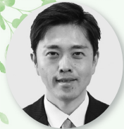
大阪府知事 吉村 洋文

大阪府母子寡婦福祉連合会の皆様には、日頃から大阪府のひとり親家庭等福祉行政の推進に格別のご理解、ご協力をいただき、厚くお礼申し上げます。