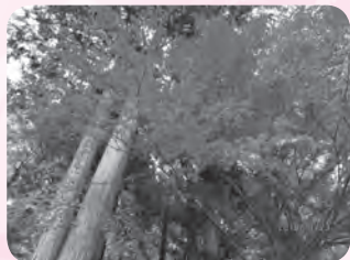
最上山公園の紅葉

少し肌寒い秋晴れの11月23日(祝)総勢68名バス2台で岡山県美作市へ行って来ました。まずは兵庫県宍粟市にある最上山公園に向かいました。「もみじ山」の名のとおり赤く色づいた紅葉が山