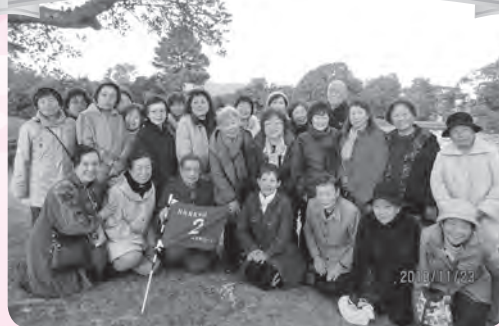
衆楽園での記念撮影