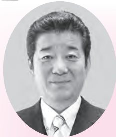
大阪府知事 松井 一郎