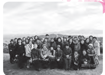
海を背景に記念撮影

前日の雨から一転して朝から好天に恵まれ、まずは新鮮な魚や野菜、ドライフルーツなどが並ぶ日生五味の市でお買物。入口の屋台の牡蠣がいっぱい入ったお好み焼き、通称『カキオコ』のソースののにおいに後ろ髪を引かれながら、昼食会場へ。その後、日本のエーゲ海と言われている牛窓へと向かいました。牛窓オリーブ園の高台から眺める海は絶景で、海をバックに記念撮影し、見つけると幸せになれるというハートの形をしたオリーブの葉を探しました。そこから最後のみかん狩り農園へ。今年の出来はあまり良くないとお話でしたが、食べ放題のみかんはとても甘くおいしく、おみやげに一生懸命取りました。3キロのみかんを持ち帰るのに思案をしましたが、無事に帰路につき、楽しい1日を過ごせました。