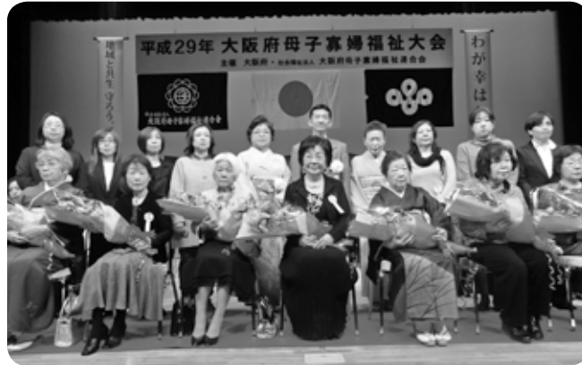
大阪府知事表彰を受賞された方々

第2部では、己抄呼くMisako(笑う体操を楽しみました。己抄呼さんの軽妙なお話ぶりでいろいろな体操を教えてくださいました。会場では大きな笑いが起こっていました。会場が皆、笑顔になった後、コーラスグループ「リリーエコー」と共に春にちなんだ歌を歌い閉会となりました。