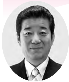
大阪府知事 松井 一郎

新年あけましておめでとうございます。 健やかに新春をお迎えのことと心からお慶び申し上げます。